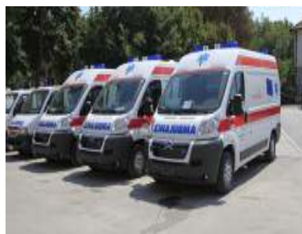
Набављено преко 200 амбулантних возила