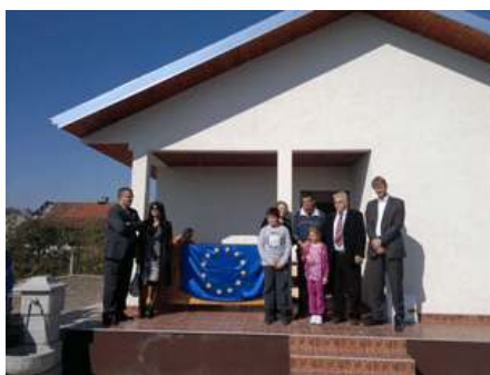
29 милиона евра за решавање стамбеног питања избеглица