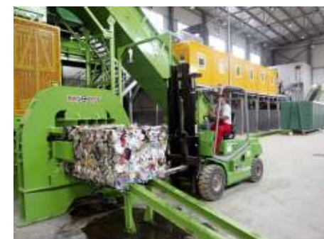
180 милиона евра за унапређење инфраструктуре