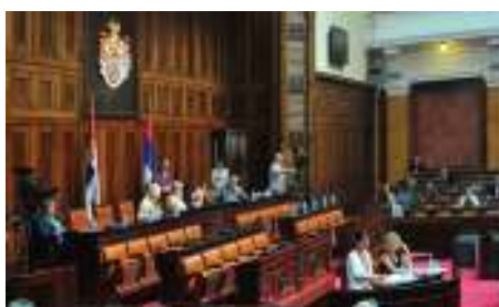
Реформа државне управе и усклађивање са правним тековинама ЕУ