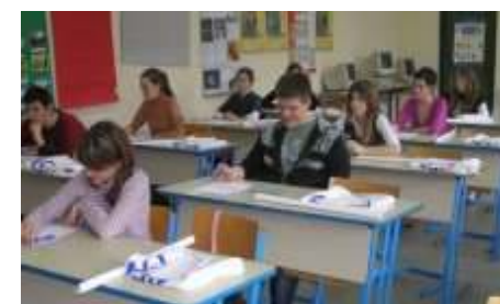
Реформа образовања на свим нивоима